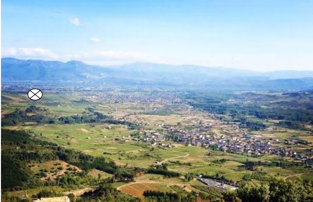
Emplazamiento de San Esteban a la izquierda. Vista del municipio de Cacabelos desde el Castro del Monte Vizcaíno. (Foto: Adrián Arias).

Desde el punto de vista geomorfológico, se trata de una zona aluvial del bajo Bierzo sustentada en sedimentos del Mioceno, tierra de color rojizo característica de la comarca, con un espectacular paisaje de viñedos y frutales.